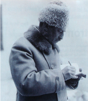
Sven Hedin, upptäcksresande med starka sympatier för Tyskland