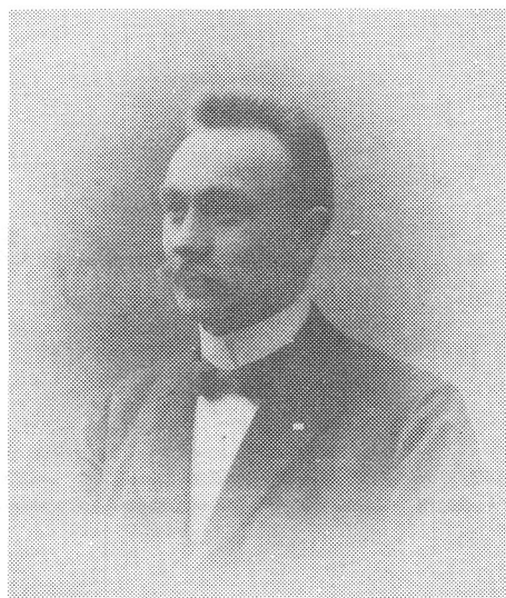
Foto från tiden i Bjärka-Säby

Som chef och medarbetare var E. uppskattad och avhållen. Härför hade han att tacka ej blott sin sunda och ödmjuka inställning till sitt och andras arbete, han hade även den humorns gåva, som öppnar så många eljest stängda dörrar.