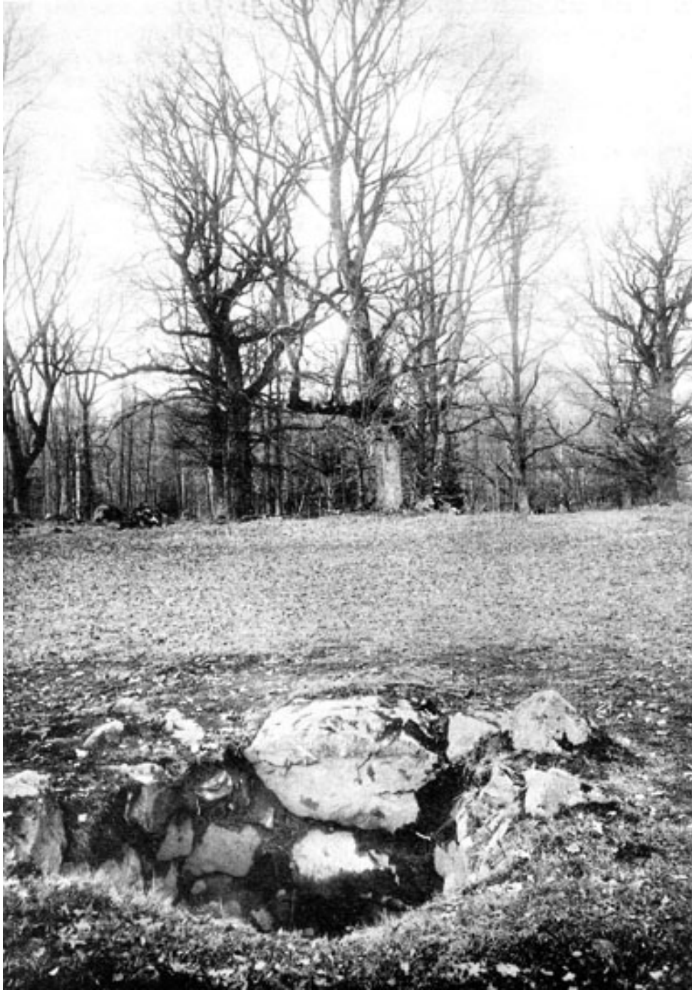
44. Brunnen vid Bjärkängen. Foto 1922.