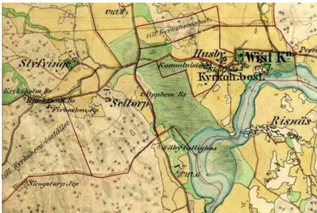
Utsnitt ur karta från 1868-1877